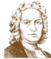
Jean Sébastien BACH ( - )