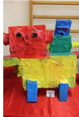
Cartons, tubes, boîtes...