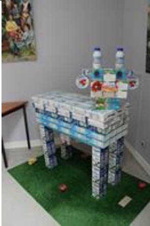
Briques de lait assemblées à recouvrir