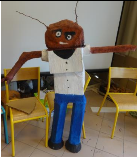
Emballages, boîte à chaussures, morceau de bois...