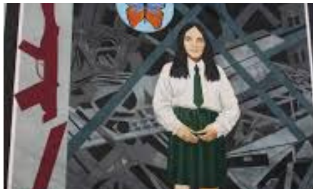
Représentation d'une petite fille morte lors

Connaissance de l'histoire d'un pays par le muralisme