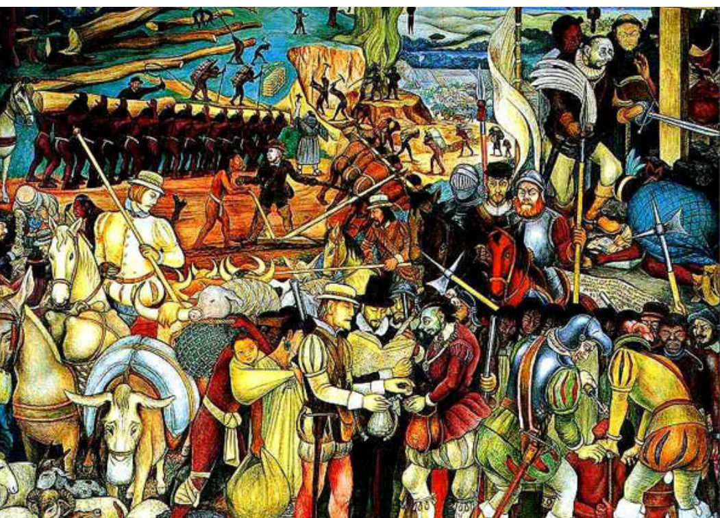
L'arrivée des espagnols , Diego Rivera, 1951