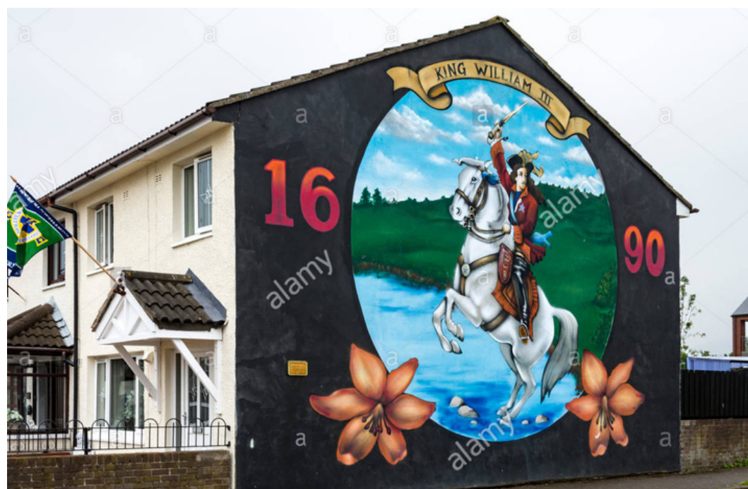
Représentation de Guillaume III à la bataille de la Boyne par les loyalistes