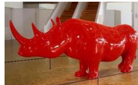
Xavier Veilhan, Rhinocéros rouge , 1999

- Intégrer des petits morceaux d'éponge à la peinture pour créer des reliefs monochromes.