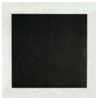
Kasimir Malevitch, Carré noir sur fond blanc , 1915

- Utiliser en plus du blanc pour obtenir un ton plus clair et composer avec ces deux nuances.