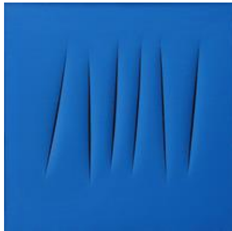
Lucio Fontana, sans titre , 1970

Décrire l'œuvre (ce que l'on voit, comment elle est faite).