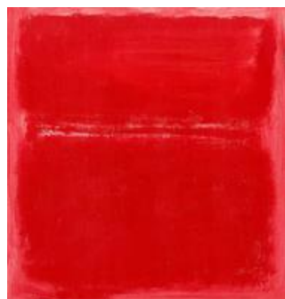
Mark Rothko, sans titre , 1970

- Utiliser en plus du blanc pour obtenir un ton plus clair et composer avec ces deux nuances.