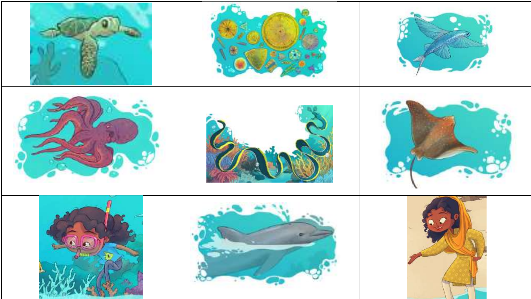
Planche de jeu :