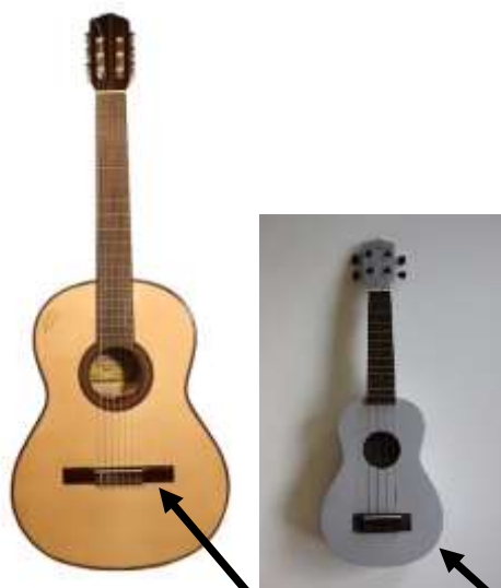
Différence taille guitare et ukuléle