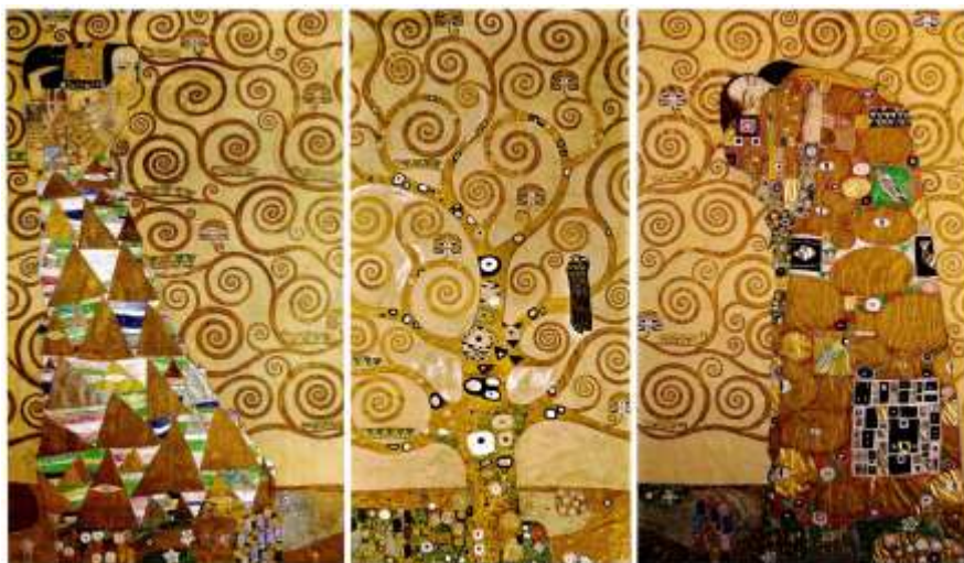
L'arbre de vie