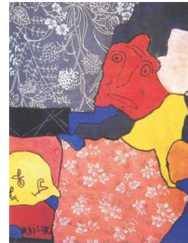
Visage Rouge, Chassac, 1962

Kveta Pacovska réalise d'étonnants collages, des jeux de miroir et de relief, de curieuses superpositions de papiers pour créer ses personnages.