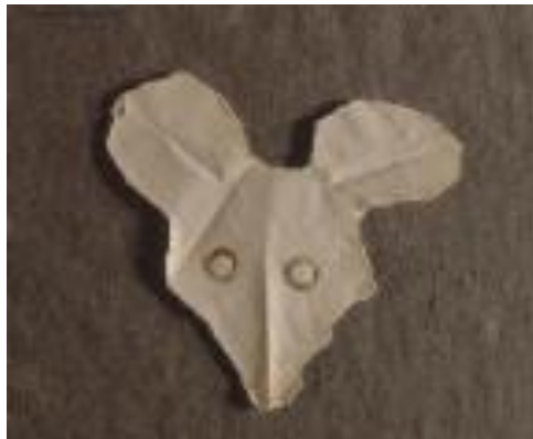
Tête de renard, Pablo Picasso, 1943