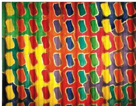
Claude Viallat Sans titre