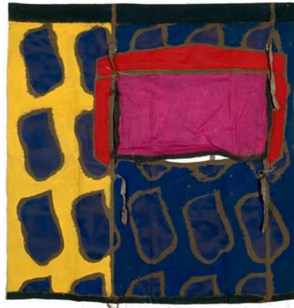
Claude Viallat Sans titre n° 20, 2006 Acrylique sur bâche - 180 x 180 cm