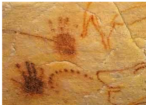
Empreintes de mains Grotte Chauvet - France