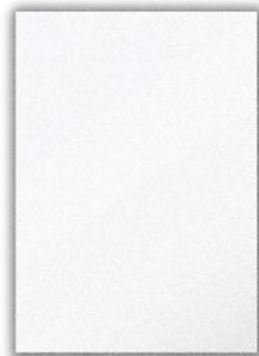
Une feuille de papier

Enigme n°2 : comment faire flotter la boule de pâte à modeler ?