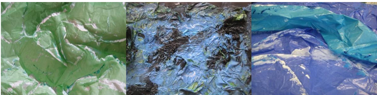
(ateliers Ecole et cinéma 2012-2013)

-utiliser des couleurs différentes selon le lieu et selon ce que l'on ressent à son évocation. Attention aux stéréotypes : on dit toujours que la mer est bleue mais elle peut être verte, grise, et pourquoi pas rouge ou violette ? Jouer avec les nuances, les mélanges, les camaïeux.