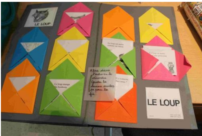
Des enveloppes (CDDP Champigny 12-13)