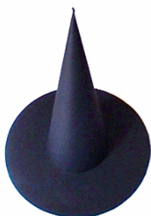
un chapeau de sorcière fabriqué

-fabriquer les objets en volume ou les représenter (cf. ci-dessus)