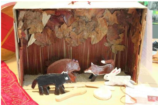
(CDDP Champigny 12-13)