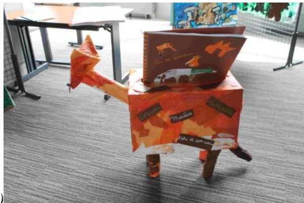
Une boîte fabriquée (CDDP Champigny 12-13 )

→ la boîte peut être en rapport avec l'histoire qu'elle raconte.