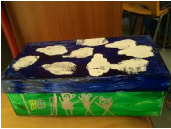
Une boîte à chaussures : Boucle d'or et les trois ours