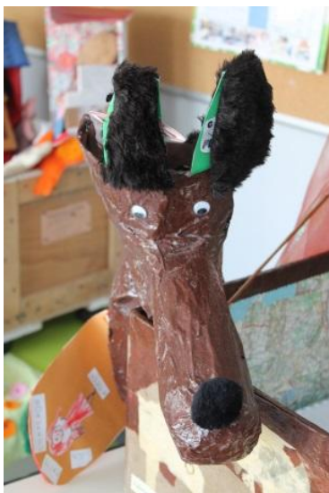
(CDDP Champigny 12-13)