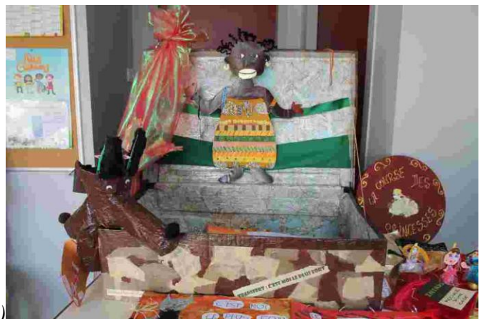
Une valise (CDDP Champigny 12-13)