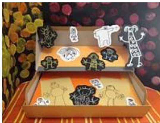
(CDDP Champigny 12-13)

On peut bien sûr dessiner et découper les personnages.